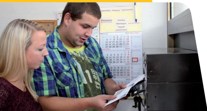
Grafik: eulenblick Kommunikation und Werbung e.K., Münster